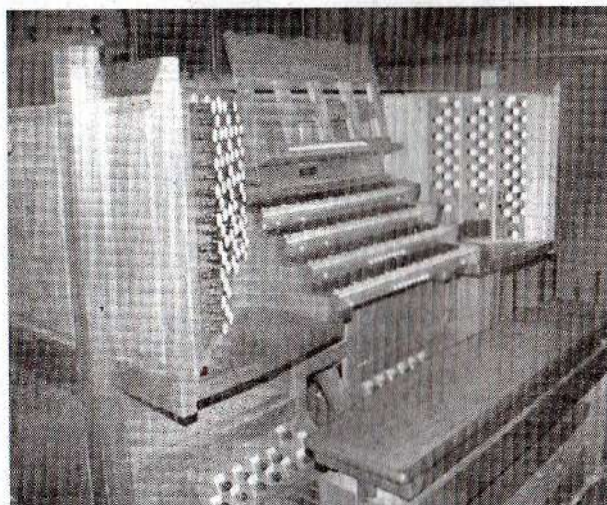
La console mobile du Grand Orgue.