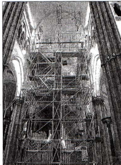
Cet impressionnant échafaudage sert d'armature à la construction de l'orgue, qui atteindra les vingt mètres de hauteur !

► www.grandorgue.com Pour soutenir l'association Un grand orgue pour ND de la Treille, les dons de souscription sont à adresser au 39, rue de la Monnaie. ☎ 03 28 49 51 56.