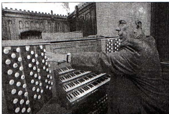
L'organiste de la Treille découvre avec enthousiasme la nouvelle console, mobile et à quatre claviers.